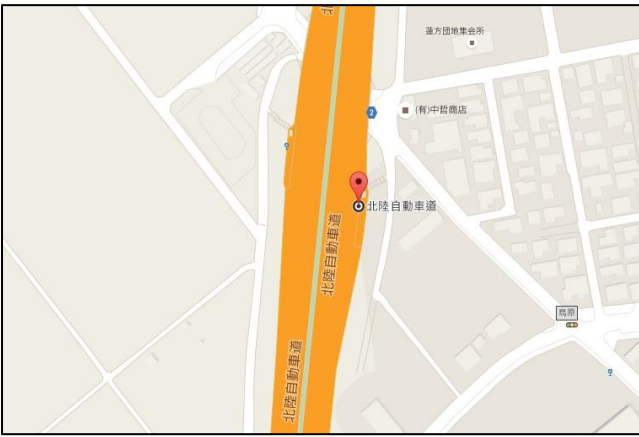
【鳥原BS】 ■鳥原バスストップ 北陸自動車道上り線 「鳥原バスストップ」