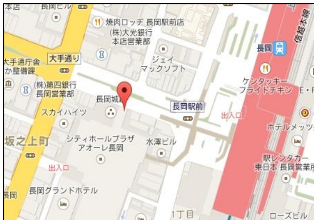
【長岡】 ■JR長岡駅大手口 アオーレ長岡前