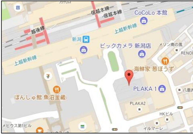
【新潟駅】 ■JR新潟駅南口 8番のりば