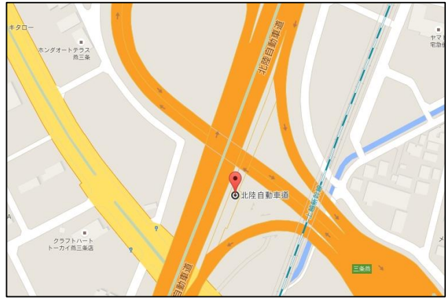
【三条・燕BS】 ■三条・燕バスストップ 北陸自動車道上り線 「三条燕バスストップ」