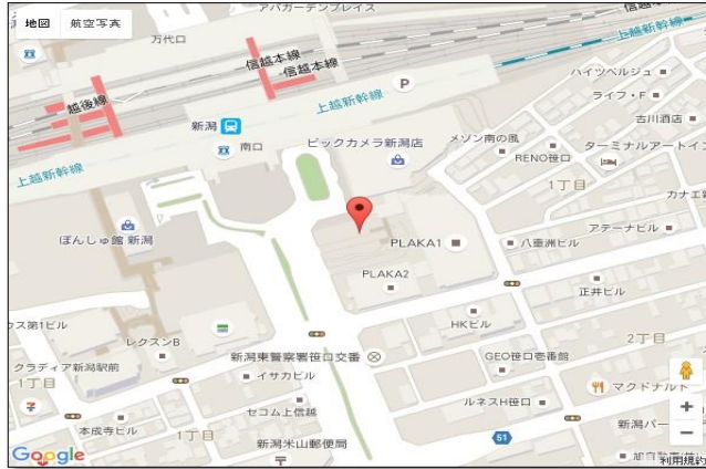
【新潟駅】 JR新潟駅南口