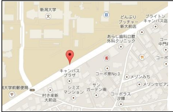
【新潟大学前】 居酒屋八珍柿 向かい側