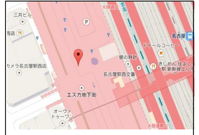
【名古屋】 JR名古屋駅太閤通口 ゆりの噴水前 ※ゆりの噴水前からバス停まで、係員が誘導いたします。 必ず、ご出発の20分前までにご集合下さい。