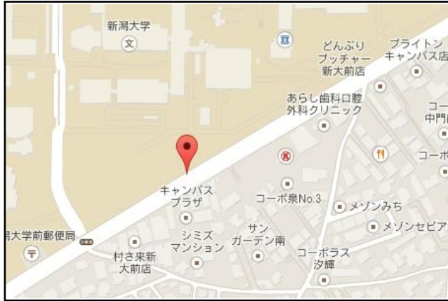
【新潟大学前】 居酒屋八珍柿 向かい側