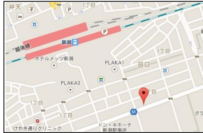
【新潟駅】 JR新潟駅南 アミー号専用駐車場 JR新潟駅を出て、新潟駅南口交差点まで直進。 交差点を左折すると「マクドナルド新潟南店」があります。 マクドナルド横の駐車場が集合場所です。